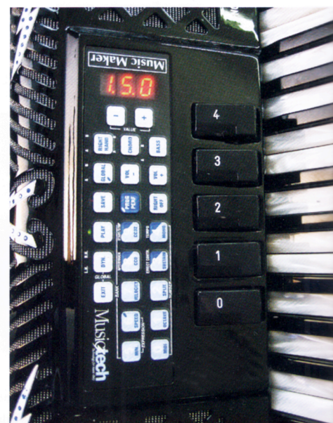
Music Maker Digital 50.

esattamente identico a una fisarmonica classica, la cui parte meccanica viene tuttora costruita a Castelfidardo da esperti artigiani del settore". Ma Musictech non si accontenta dei risultati finora raggiunti, tra cui la creazione in buona parte del mondo dei MUSICTECH POINT, una rete efficiente per garantire il montaggio e l'assistenza dei suoi sistemi anche in loco... infatti l'azienda ha presentato nel gennaio 2013 due nuovi prodotti all'avanguardia, di cui Claudio ci parla nel dettaglio: "La Dual Link Digital Box è la prima fisarmonica digitale completamente programmabile mediante touch screen, estremamente facile da utilizzare e programmare, la quale, oltre alla classica uscita MIDI OUT per il collegamento a un expander